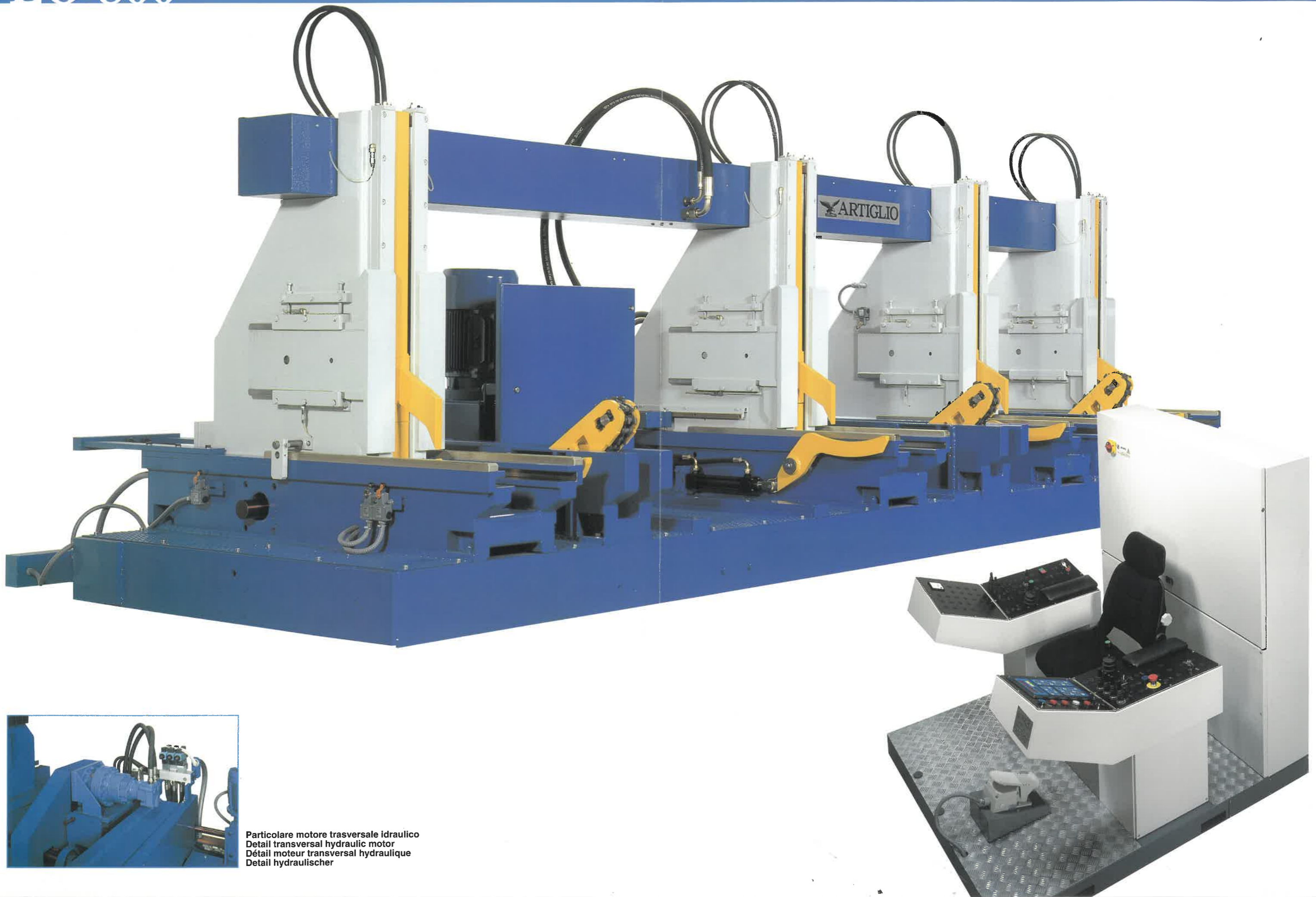
Particolare motore trasversale idraulico Detail transversal hydraulic motor Détail moteur transversal hydraulique Detail hydraulischer